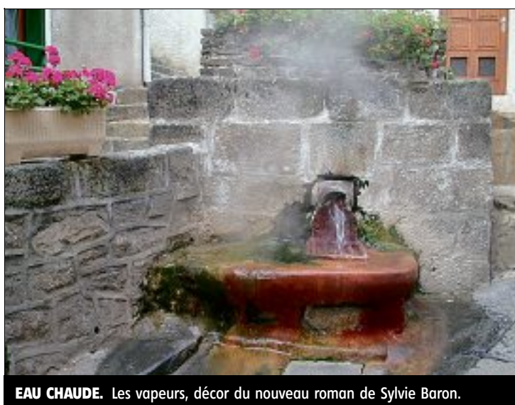
EAU CHAUDE. Les vapeurs, décor du nouveau roman de Sylvie Baron.

S ylvie Baron est une romancière militante, militante de la ruralité. Chacun de ses livres est un combat. Hier la désertification médicale ( L'auberge du pont de Tréboul ), la gestion raisonnée des forêts ( L'héritière des Fajoux ), la biodiversité ( Les ruchers de la colère ), les maires ruraux ( Rendez-vous à Bélinay ), le savoir-faire des territoires ( Un coin de parapluie ) – tous chez Calmann-Lévy, puis les libraires indépendants ( Le cercle des derniers libraires ) – chez De Borée celui-là... et aujourd'hui avec Impasse des Demoiselles la flamme de ceux qui font revivre l'âme et le patrimoine des villages. « Ce sont les caractéristiques de mon projet littéraire : parler de nos territoires aujourd'hui, atouts, faiblesses, spécifi-