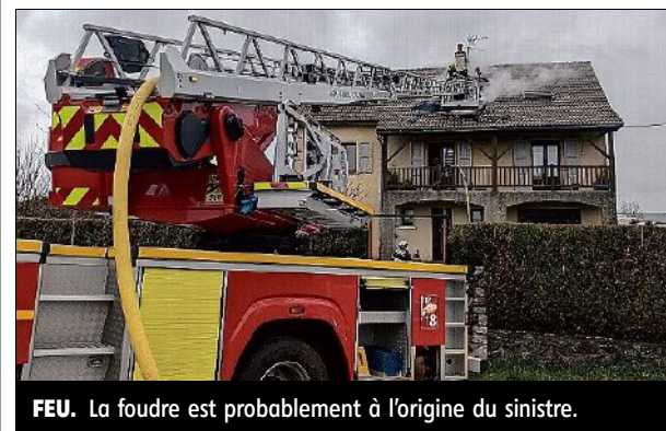
FEU. La foudre est probablement à l'origine du sinistre.

Aux Ternès, un incendie s'est déclaré dans une maison d'habitation, sur la route de Cussac, probablement à cause de la foudre. Une partie du toit s'est effondrée. Les pompiers de Saint-Flour sont intervenus sur les lieux vers 9 heures. Ils ont lutté pour maîtriser le feu, tout en protégeant au mieux la maison, dont les combles sont aménagés, jusqu'en début d'après-midi. Aucun blessé n'est à déplorer. ■